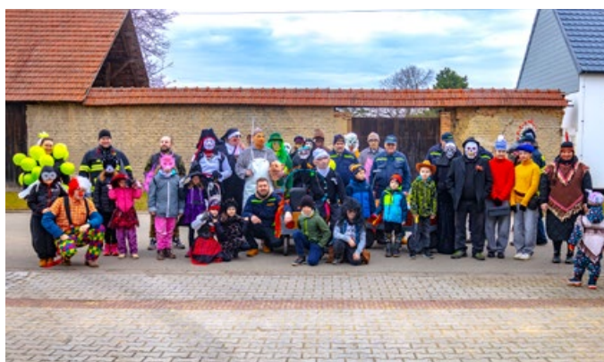
Ostatky – hasiči Žatčany