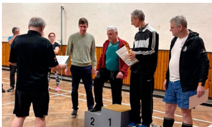
Badminton – turnaj