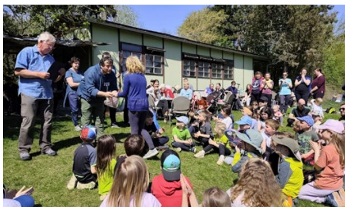
Pochodák do Starého lesa

OBCENÍ ZPRAVODAJ – vydává obec Žatčany, dne 15. 5. 2026, náklad 375 ks, řídí redakční rada, tisk povolen MK ČR E 12700. Neprošlo jazykovou úpravou. Redakční rada: Ing. František Poláček, Mgr. Tomáš Kalla, grafika-příprava a tisk Radek Lejska. Příspěvky můžete odevzdávat na OÚ Žatčany nebo zasílat na e-mail: obec@obeczatcany.cz