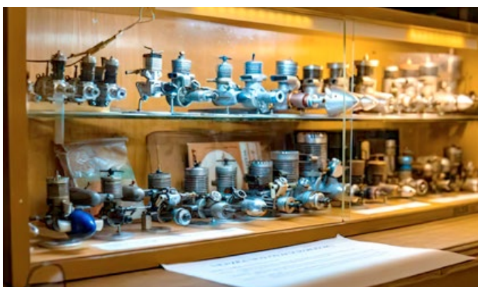
Modeláři – výstava 2022