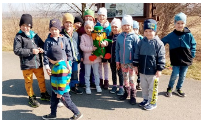
Jaro v naší školce