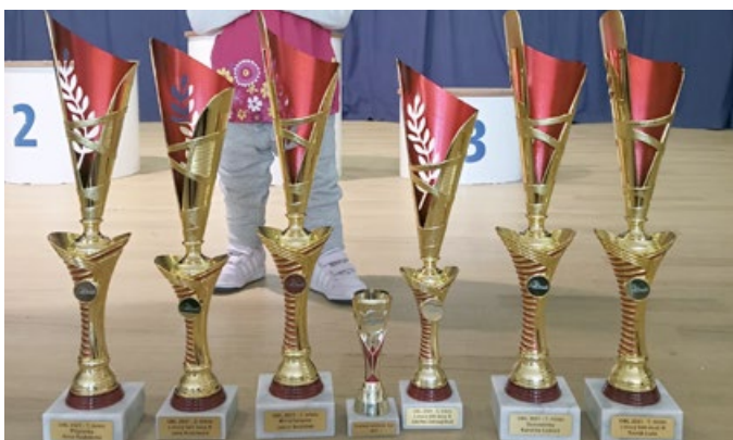
Orel – atletika