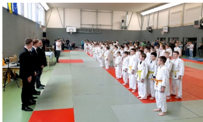
Orel – judo