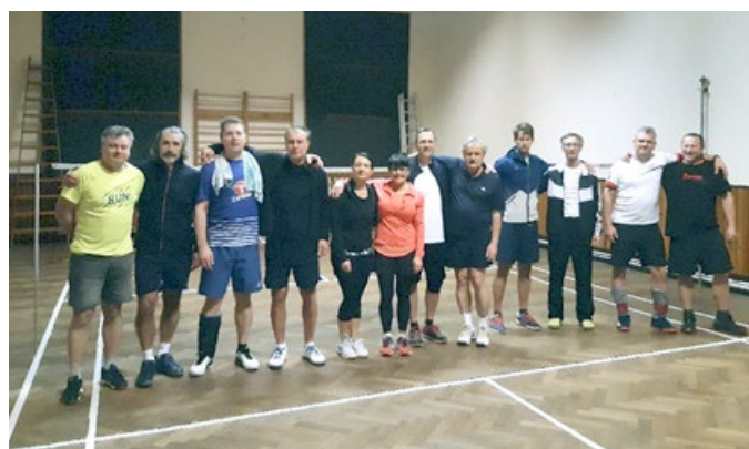
1. žatčanský badmintonový turnaj