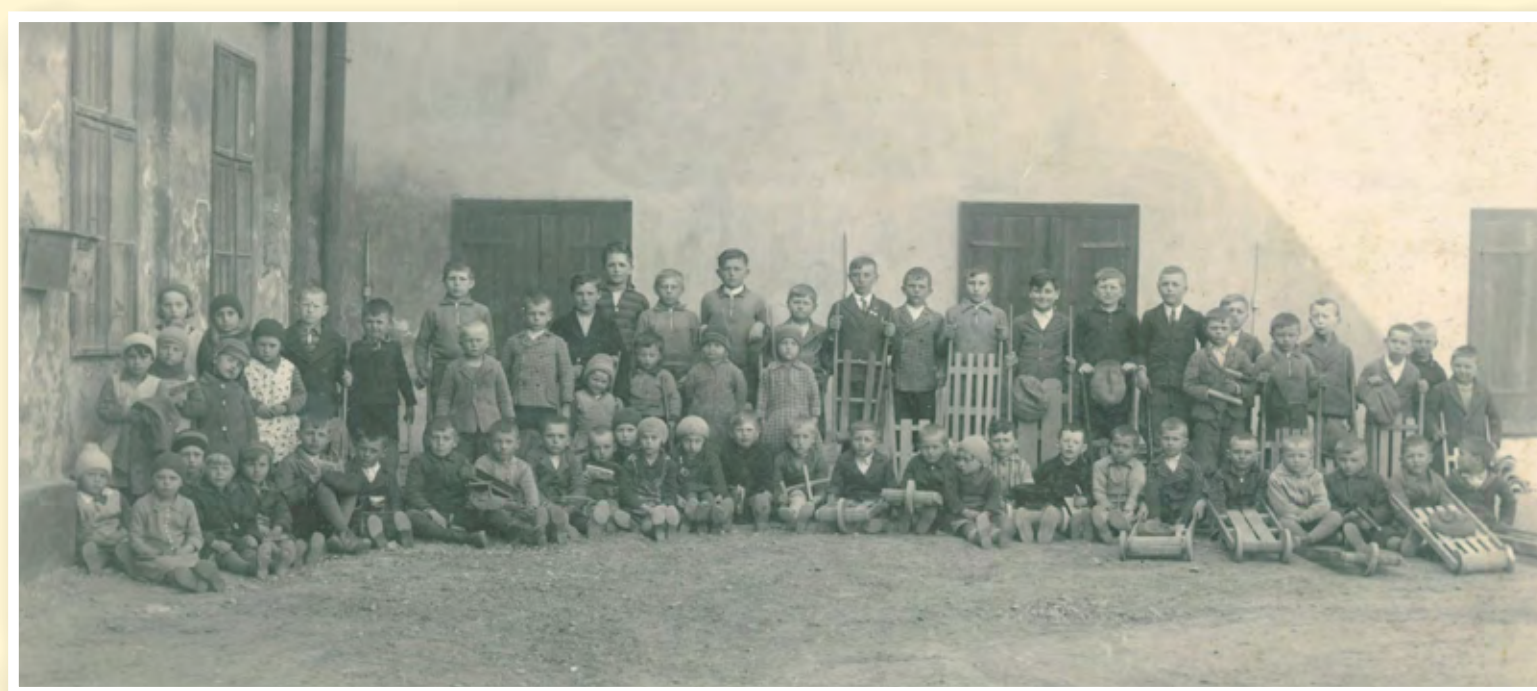
Děti hrkající o Velikonocích roku 1938 před budovou bývalého mlýna