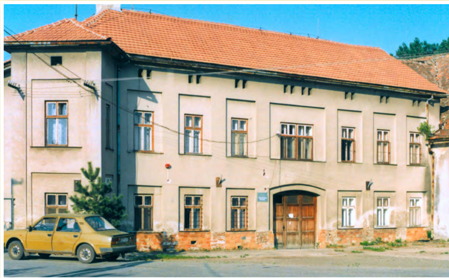
Dvůr v roce 2006