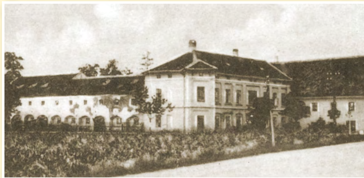
Dvůr kolem roku 1947

Po roce 1989 budovy dvora přešly do správy Pozemkového fondu. V roce 2016 byl dvůr v restitucích navrácen Biskupství brněnskému.