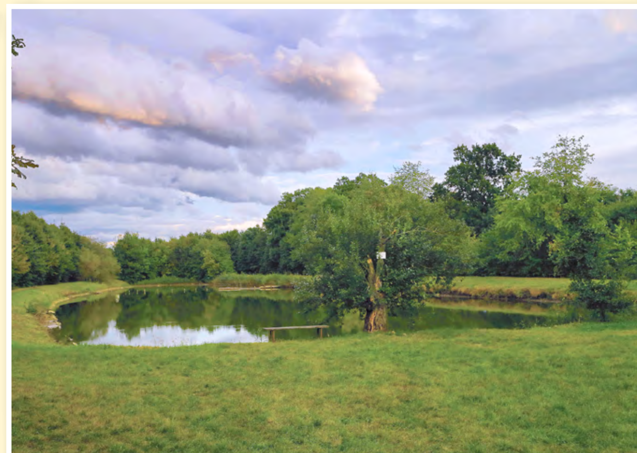
Rybník Na Loučkách