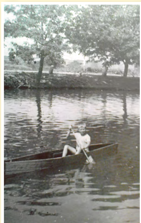
Rybník Na Dolech v roce 1956

V letech 1965–1967 byl jako závlahová nádrž vybudován rybník Na Loučkách, který je v současné době jediným žatčanským rybníkem.