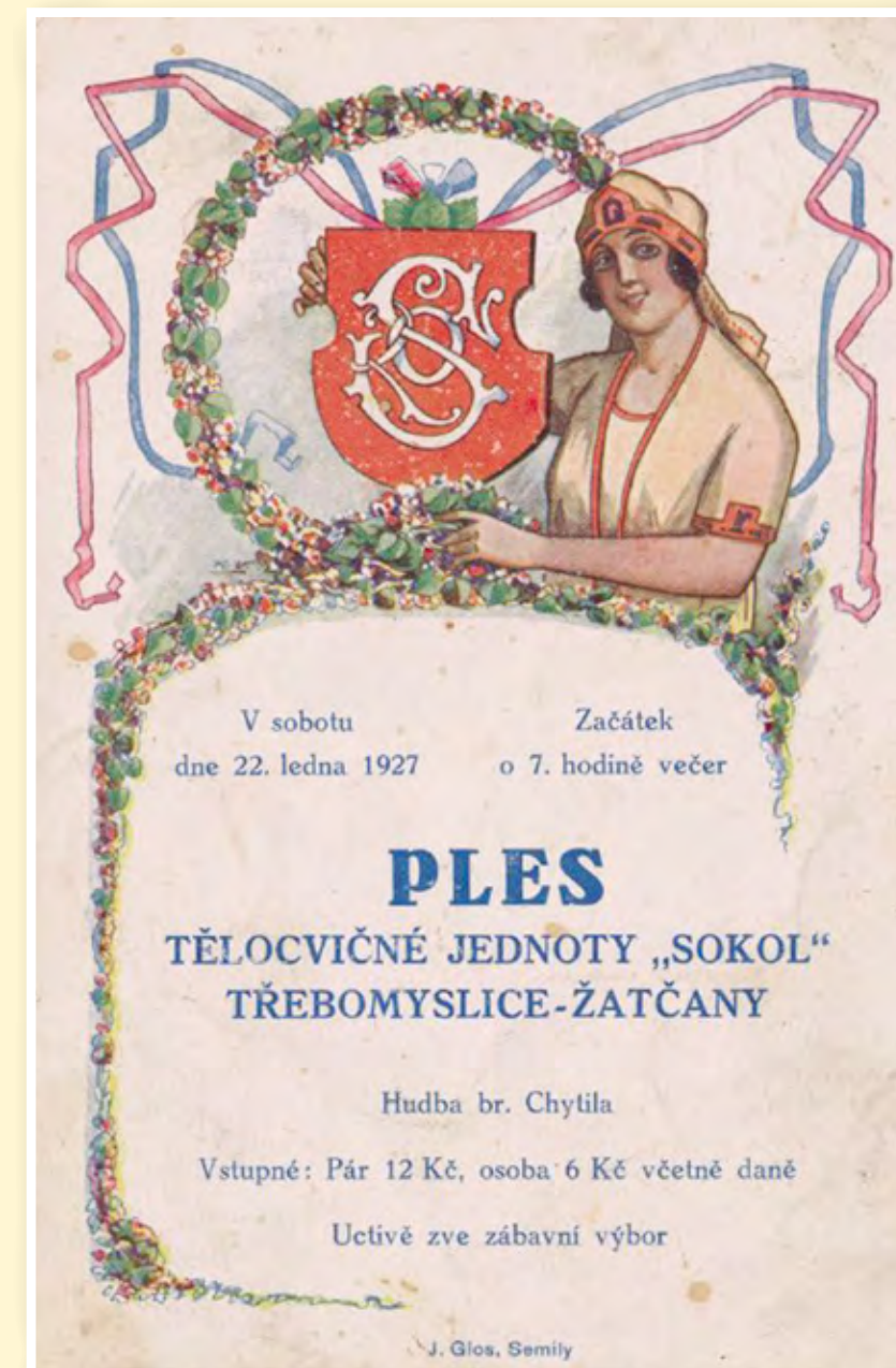
Pozvánka na ples v roce 1927

Od roku 1993 se stala jednota Sokol znovu součástí České obce sokolské. V roce 1995 se oddíl kopané osamostatnil do samostatného SK Žatčany. Sokolovna je využívána ke cvičení žáků místní základní školy. V posledních 20 letech postupně