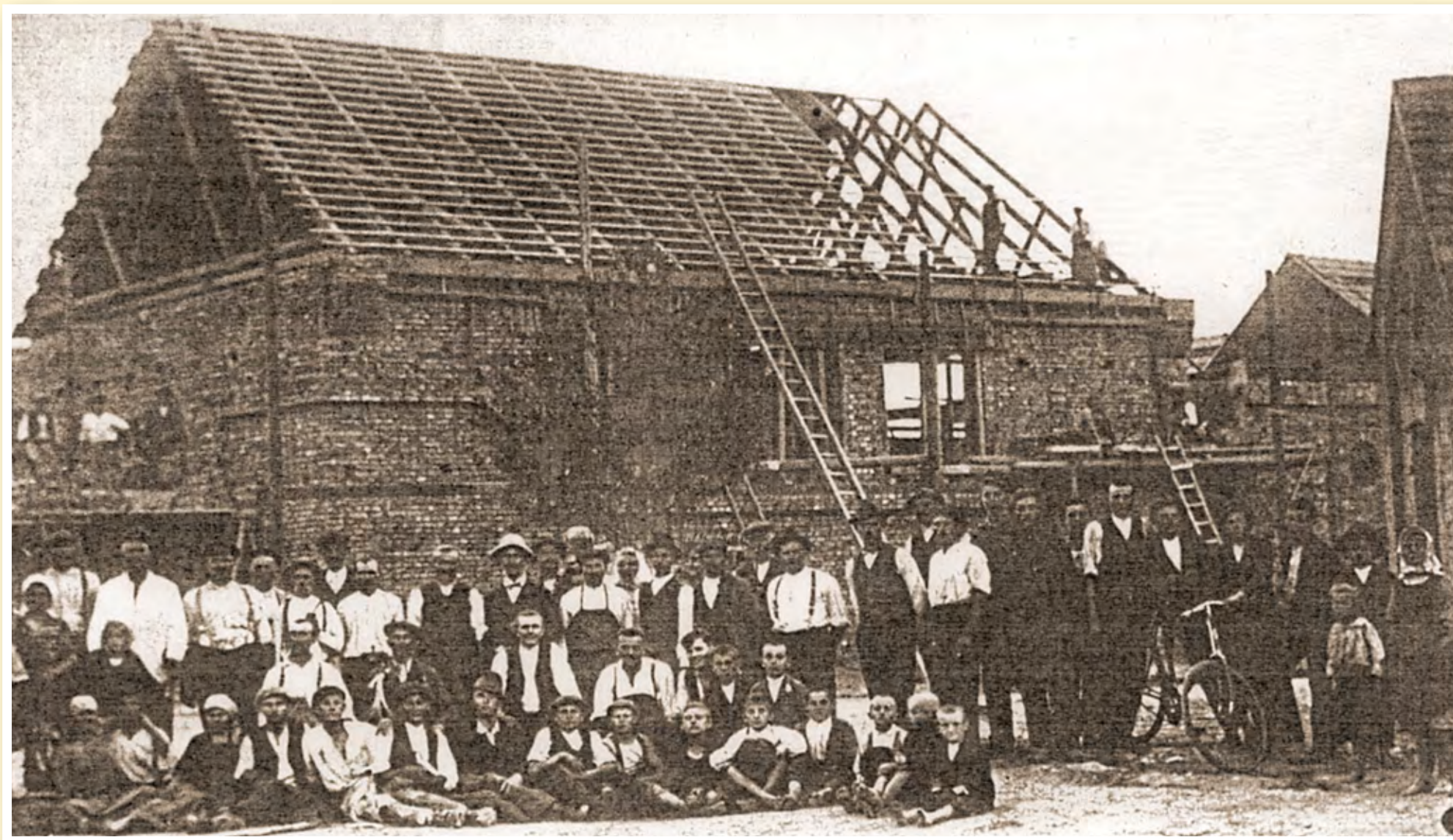
Stavba sokolovny v roce 1922

Činnost Sokola byla zakázána ve válečných letech 1915–1918 a 1941–45. Po roce 1948 došlo ke vzniku tzv. sjednocené tělovýchovy. Do jednoty byl včleněn SK Žatčany. Od prosince 1953 se stala vlastníkem sokolovny dobrovolná sportovní organizace DSO Baník. V roce 1956 došlo ke změně názvu na DSO Tatran.