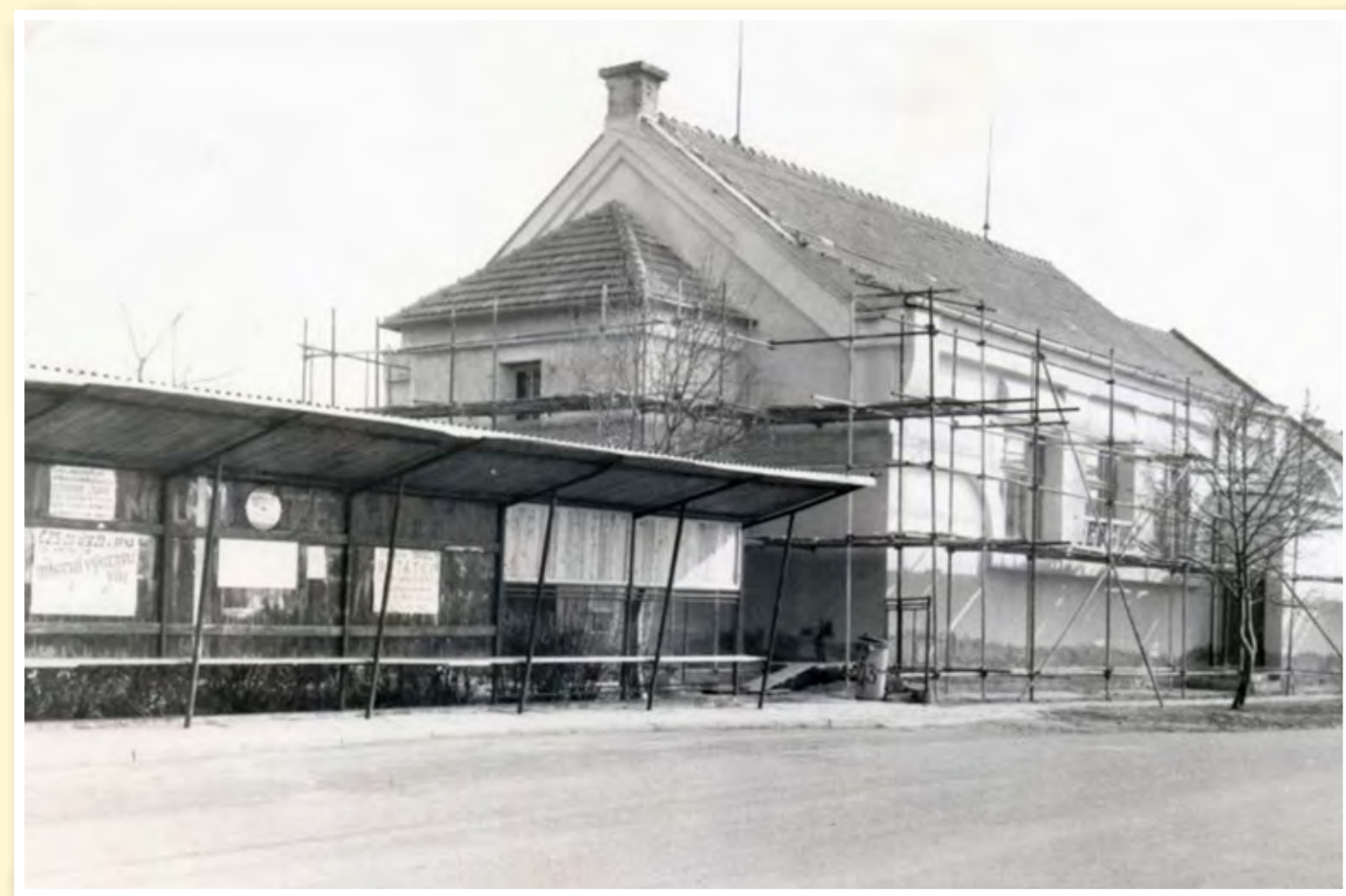
Sokolovna a zastávka v roce 1992

proběhla rekonstrukce jednotlivých částí od podlah, přes okna a fasádu až po střechu.