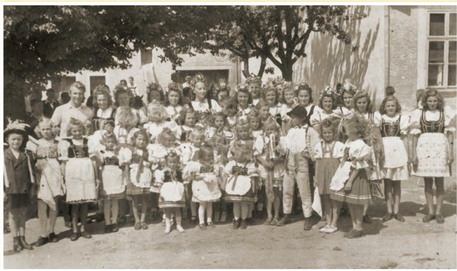
Hodový průvod před Rychlíkovým mlýnem v roce 1945, nebo 1946

ZAJÍMAVOST: Na poli vedle Rychlíkova mlýna bylo krátkou dobu před 2. světovou válkou také fotbalové hřiště. Před vybudováním současného hřiště pod kostelem v roce 1949 bylo fotbalové hřiště na Stání v místě garáží za obecní skládkou. Přes severní část hřiště na Stání vedla cesta. Utkání se někdy muselo přerušit, aby mohl projet povoz. Při žnících se na hřišti mlátilo obilí.