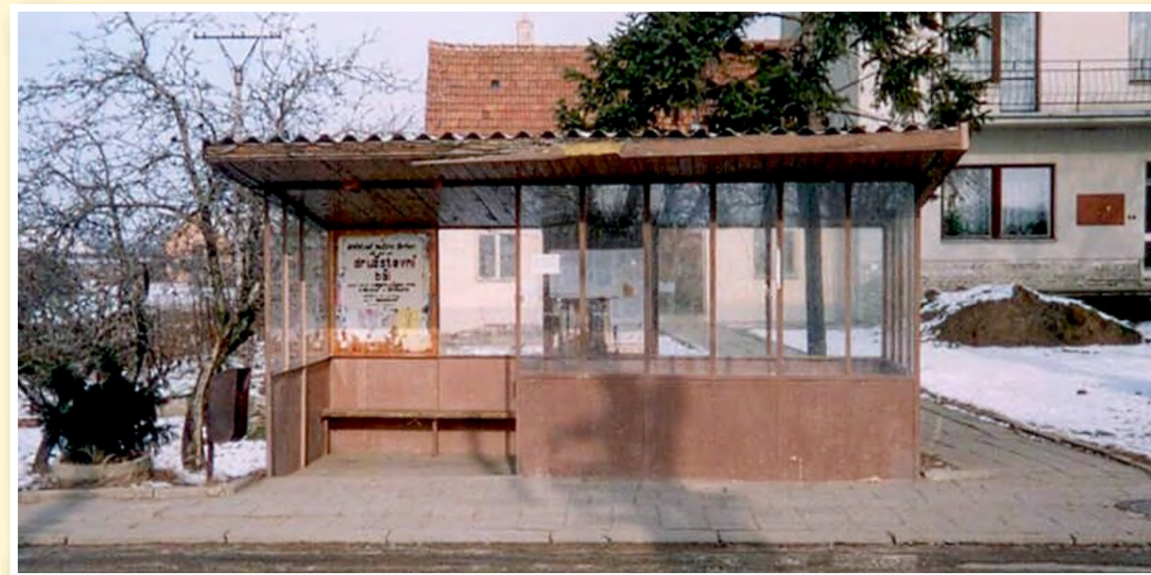
Autobusová čekárna do roku 1998

Autobusová zastávka je zde od 60. let 20. století. Současná podoba je z roku 1998. Předtím byla čekárna kovová s prosklenými tabulemi.