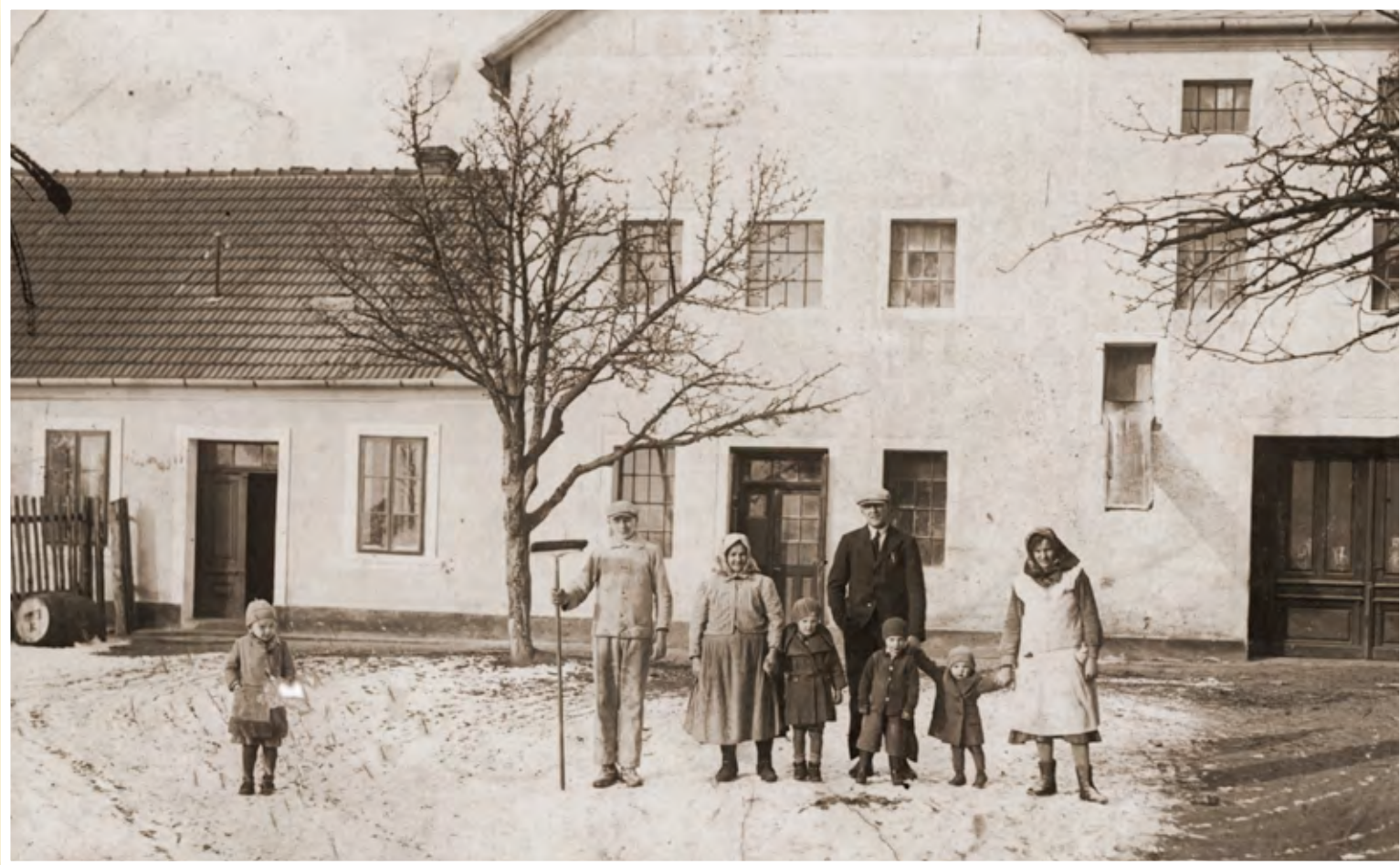
Rodina mlynáře Rychlíka před mlýnem v roce 1935

Velký rodinný dům č. 265 za autobusovou zastávkou býval mlýnem. Pamětníci jej znají jako Rychlíkův mlýn . Tento fakt dnes připomíná pouze označení zastávky „U mlýna“. Unikátní na tomto mlýně bylo, že měl neobvyklý motorový pohon.