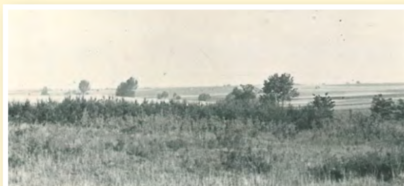
Starý les v roce 1953

Ostatním zemědělcům byly vyměřeny nové pozemky bez ohledu na původní vlastnictví. Z mozaiky políček s mezemi a řadami ovocných stromů postupně vznikly lány s několika plodinami.