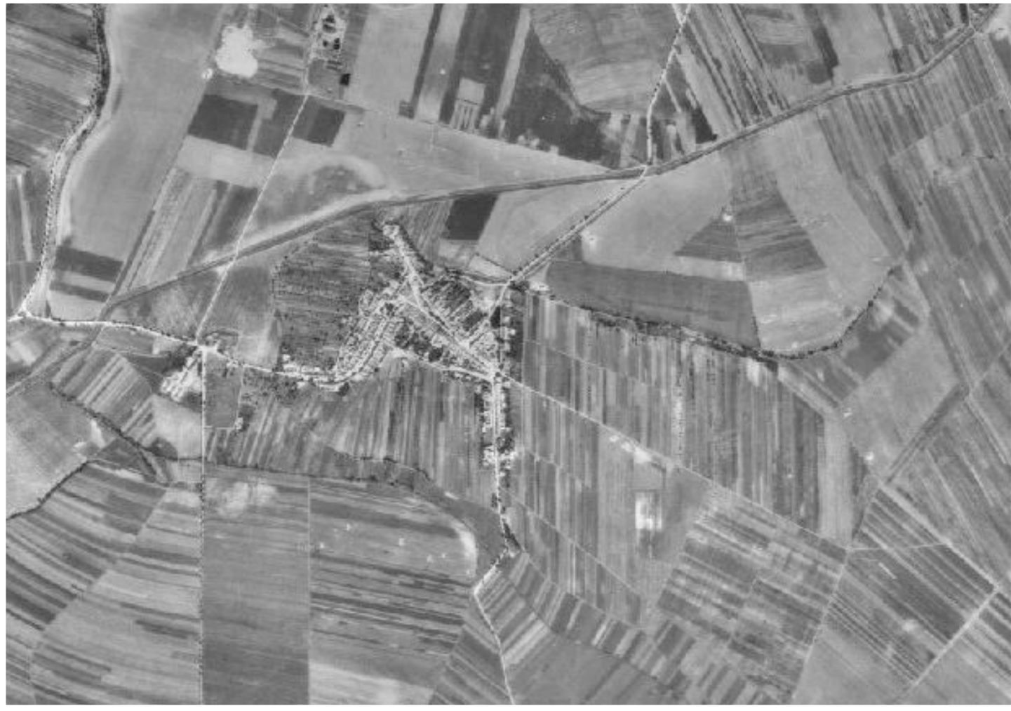
Mozaiková krajina drobných polí v roce 1953

Výrazný zásah do krajiny způsobila kolektivizace a scelování pozemků v 50. letech 20. století . Návazně na vznik JZD proběhly po žních v roce 1950 hospodářsko-technické úpravy pozemků, kdy byly družstevní pozemky spojeny do větších celků.