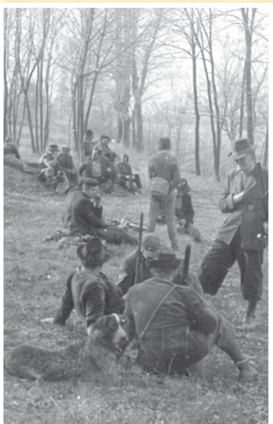
Flonky v roce 1959