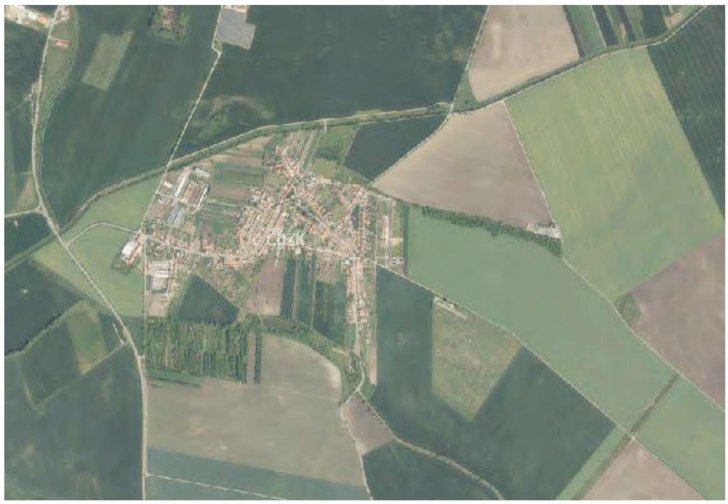
Velké celky krajiny v roce 2017