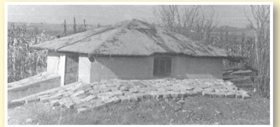
Chata Výrovka v roce 1959

PRO ZVÍDAVÉ: Už jste byli u „chaty“ Výrovka? Podobně existuje Výrovka na území Újezda. Název pochází z toho, že sem myslivci umísťovali mládě výra jako návnadu při lovu dravých ptáků.