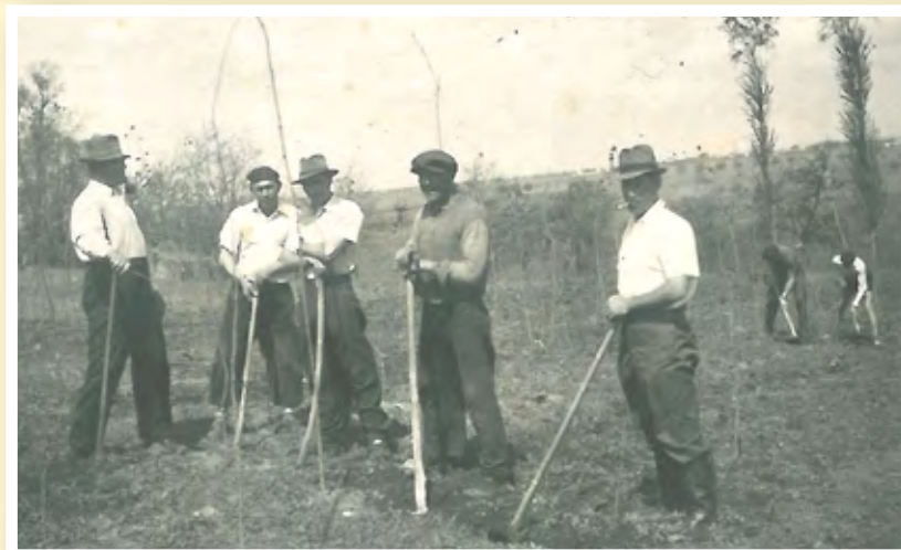
Okopávka výsadby na Flonkách v roce 1953