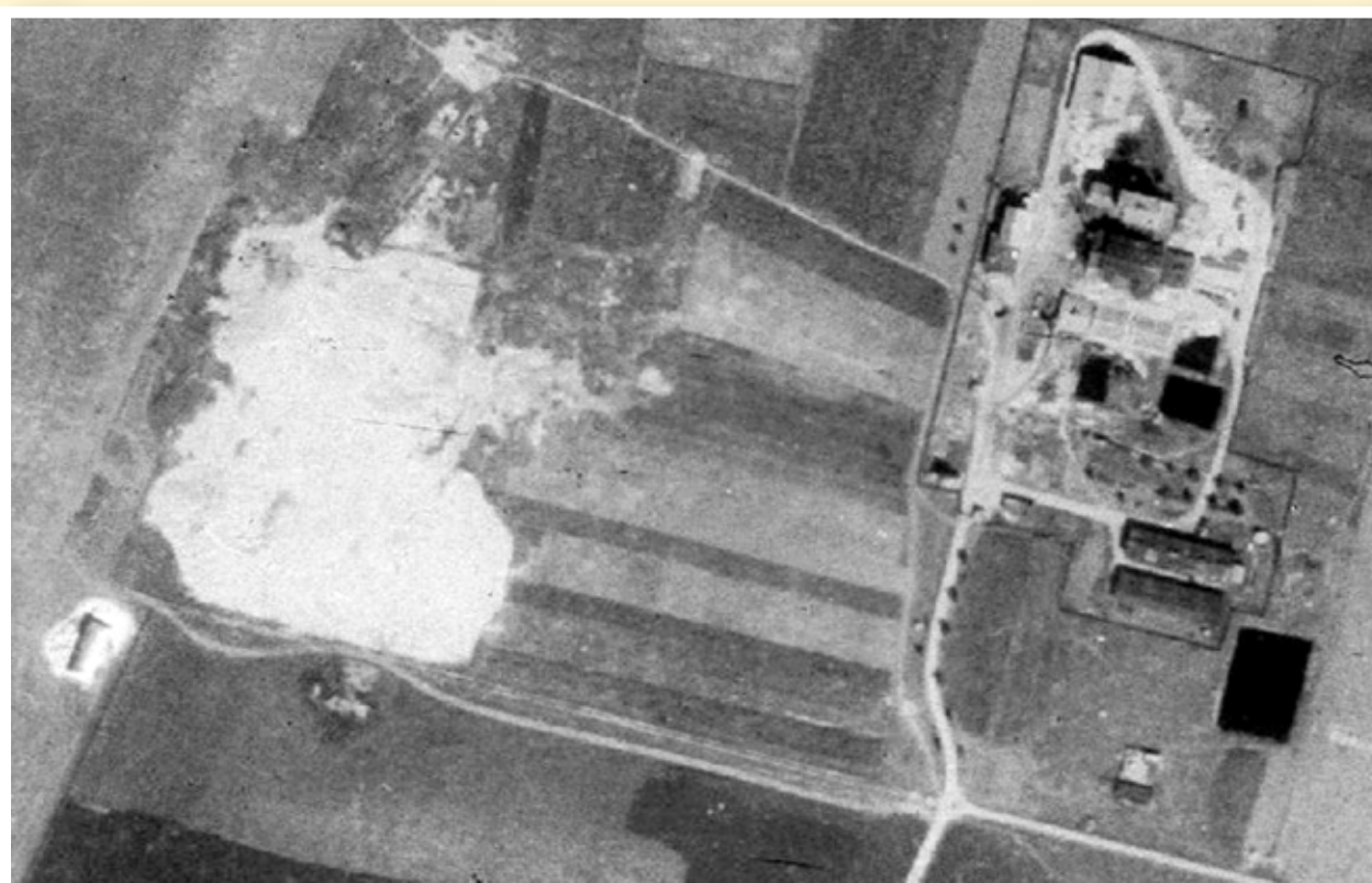
Těžební prostor v roce 1953

ZAJÍMAVOST: Písky působí tak trochu jako z jiného světa. Člověk se ocitne v polopouštní krajině s drobnými písečnými dunami a mastnými písečnými slepenci. Bývaly i oblíbeným útočištěm dětí. Několik dětských generací zde svádělo bitvy mezi Žatčanačky a Telničáky. „Armády“ byly ozbrojené klacky či dřevěnými meči. Každá si jako svou základnu zvolila jeden ze ztvrdlých písečných vršků. Bojovalo se, dokud se nemuselo jít na oběd, či svačinu.