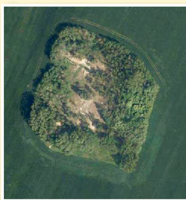
Přírodní památka Písky v roce 2017