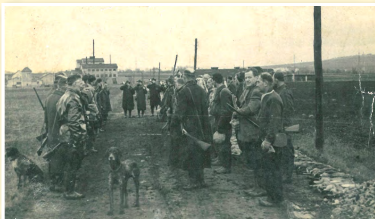
Zakončení honu v roce 1956 – v pozadí areál těžby ropy

Budovy v areálu převzal státní podnik Odbytové sdružení papírenského průmyslu (OSPAP) jako úpravnu papírů. Po roce 1989 se zde vystřídalo několik majitelů. Pozemek byl později rozdělen na dvě části s různými vlastníky. V areálu s budovami probíhá zejména výrobní činnost, na dvouhektarovém pozemku vedle areálu byla v letech 2009 a 2010 vybudována sluneční elektrárna o kapacitě 1 megawattu.