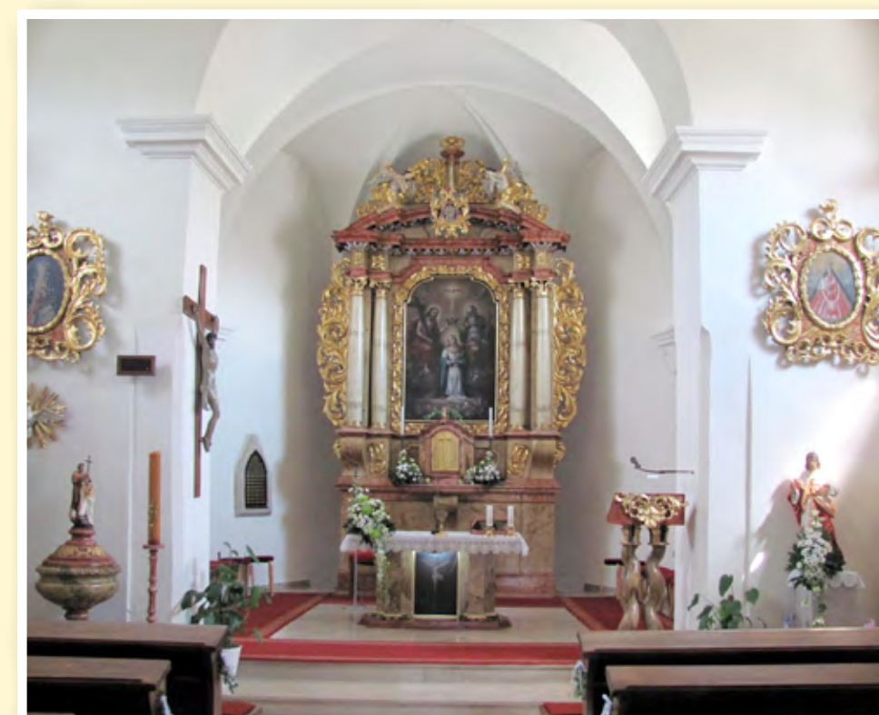
Interiér kostela v roce 2018

PRO ZVÍDAVÉ: Objevte na snímcích interiéru kostela, jak se na oltáři přemísťovali andělé?