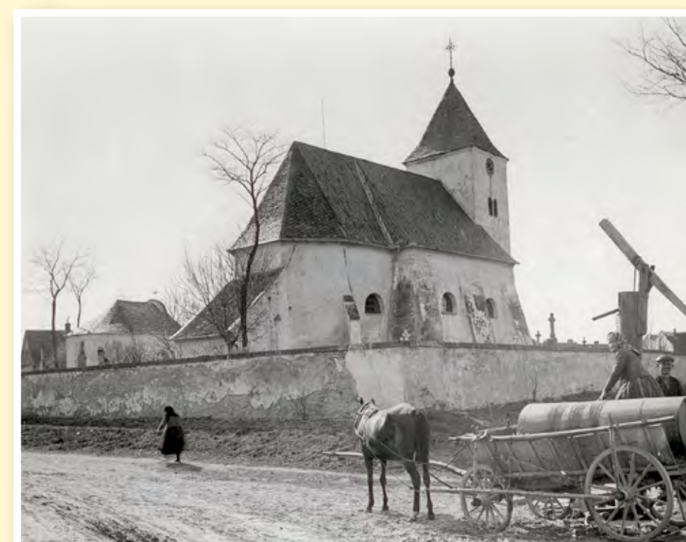
Kostel před rokem 1935 (na východní straně ještě není ciferník hodin, v popředí vahadlové čerpadlo studny Kořalnice)