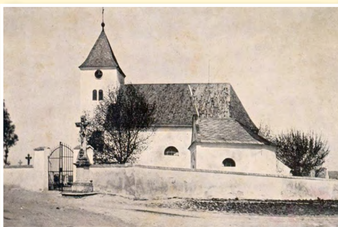
Kostel před rokem 1935