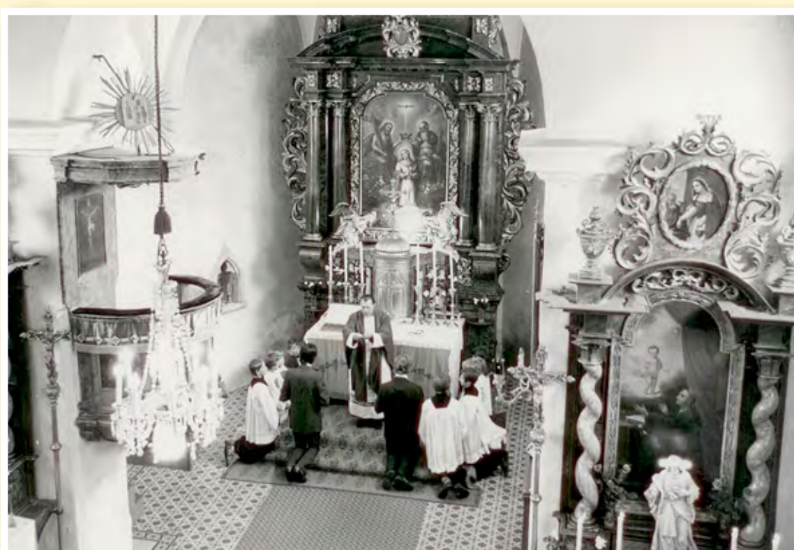
Předkoncilní interiér v 70. letech dvacátého století