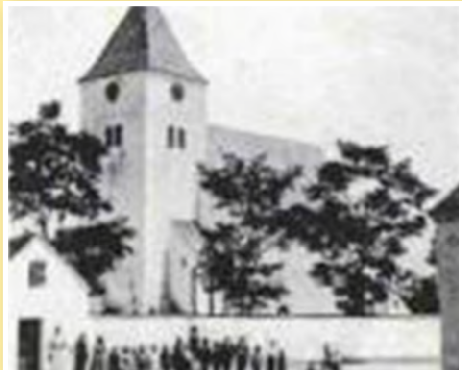
Kostel v roce 1912 (vlevo je vidět budova obecního špitálu)

Západně od kostela se nachází v domě č. 29 fara. Kostelní jednota ji koupila v roce 1919. V dřívějších dobách byla fara těsně vedle hřbitova. V její budově byl později obecní špitál. Za živým plotem z tují je ve hřbitovní zdi vidět otvor po trámech špitálu.