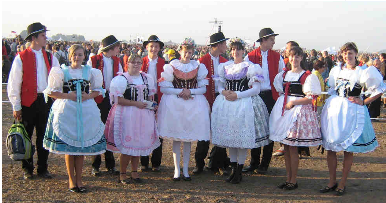
Krojovaná mládež ze Žatčan a z Moutnic v den návštěvy papeže na tuřanském letišti

Josef Sedláček, kronikář obce