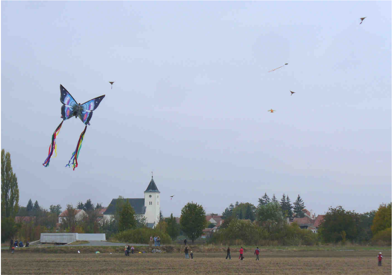
Drakiáda pořádaná v sobotu 24. října odpoledne ve spolupráci MK Alka a ZŠ a MŠ Žatčany