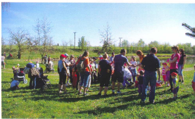
pochoďák do Starého lesa