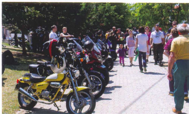
motosraz na Návsi