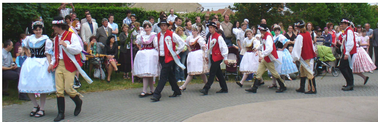
Stárci, žatčanské hody 2008

Obecní zpravodaj – vydává Zastupitelstvo obce Žatčany.