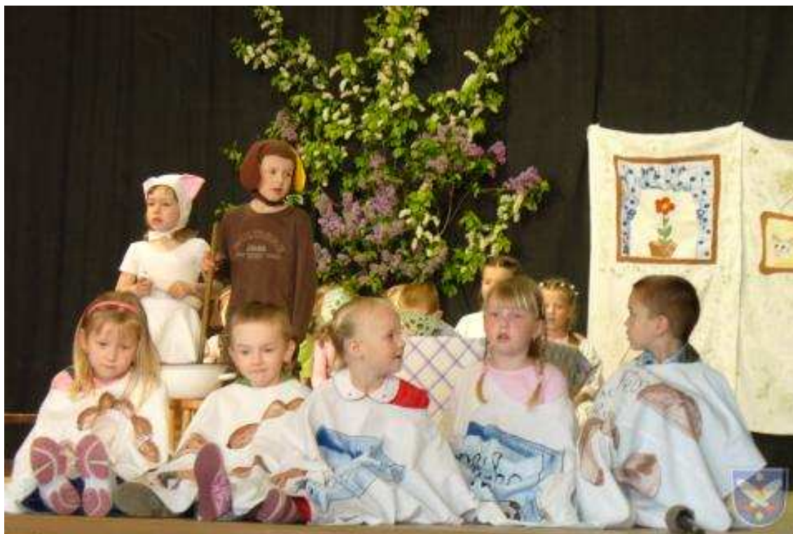
Den matek – vystoupení mateřské školy Jak pejsek s kočičkou pekli dort