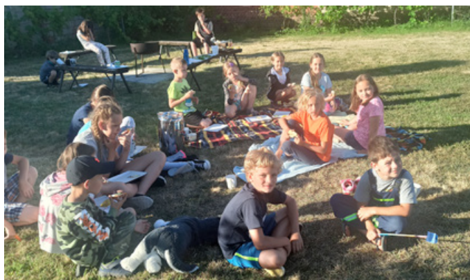
Snídaně v trávě – škola