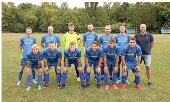
Žatčanské fotbalové mužstvo

OBECNÍ ZPRAVODAJ – vydává obec Žatčany, dne 9. 9. 2022, náklad 350 ks, řídí redakční rada, tisk povolen MK ČR E 12700. Neprošlo jazykovou úpravou. Redakční rada: Ing. František Poláček, Mgr. Tomáš Kalla, grafika-příprava a tisk Radek Lejska. Příspěvky můžete odevzdávat na OÚ Žatčany nebo zasílat e-mail: obec@obeczatcany.cz