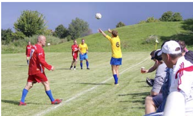
100 let od založení SK Žatčany