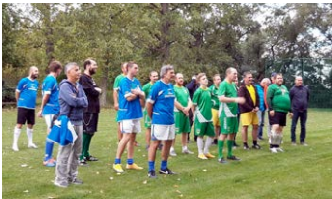
Cezava Cup 2021