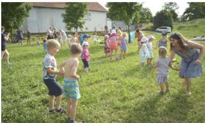
Vzpomínka na léto