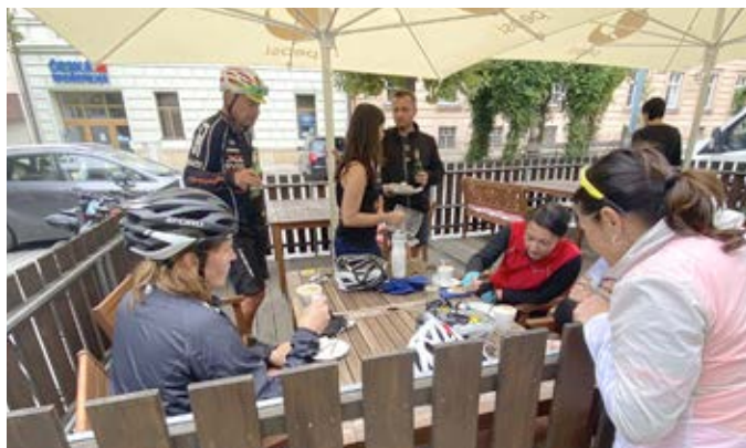
Cyklovýlet – Šakvice