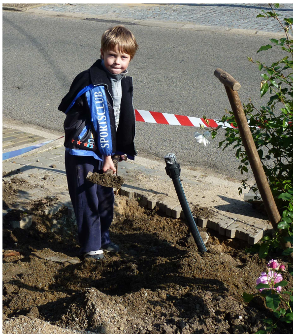
Občané dokončují napojení na kanalizaci.