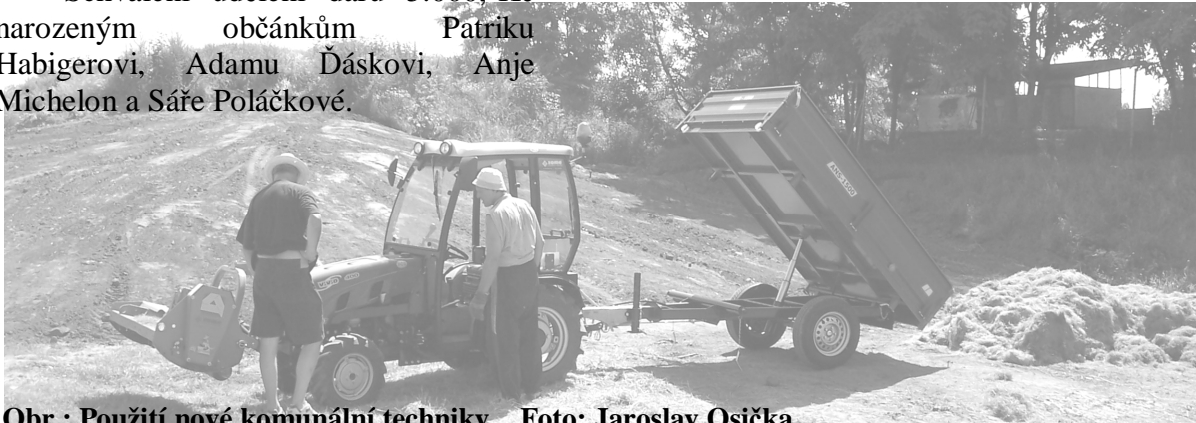
Obr.: Použití nové komunální techniky