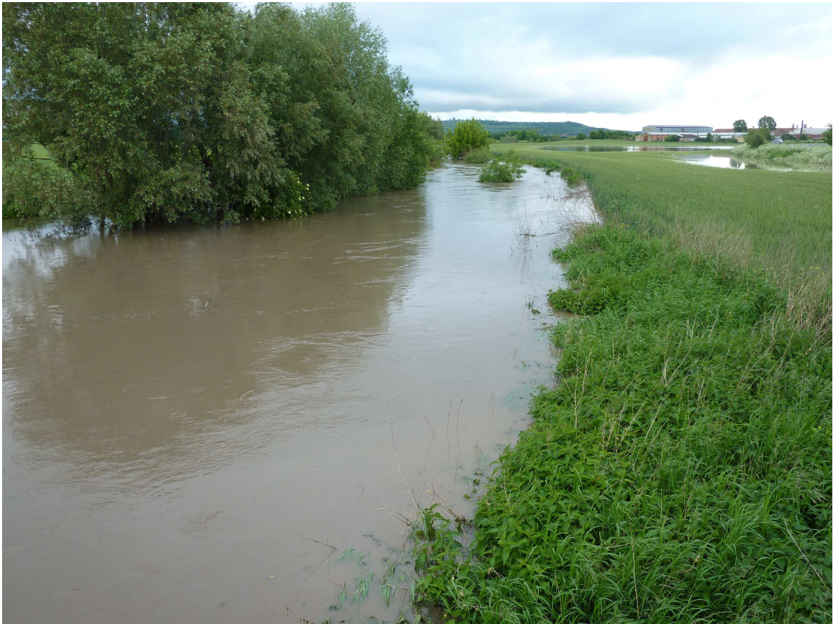
Voda z plného koryta Cezavy se vylévá do polí – pohled od mostu na státní silnici (2.6.2010)