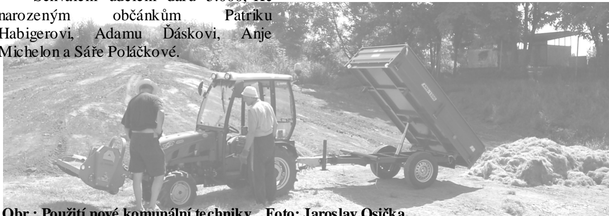
Obr.: Použití nové komunální techniky