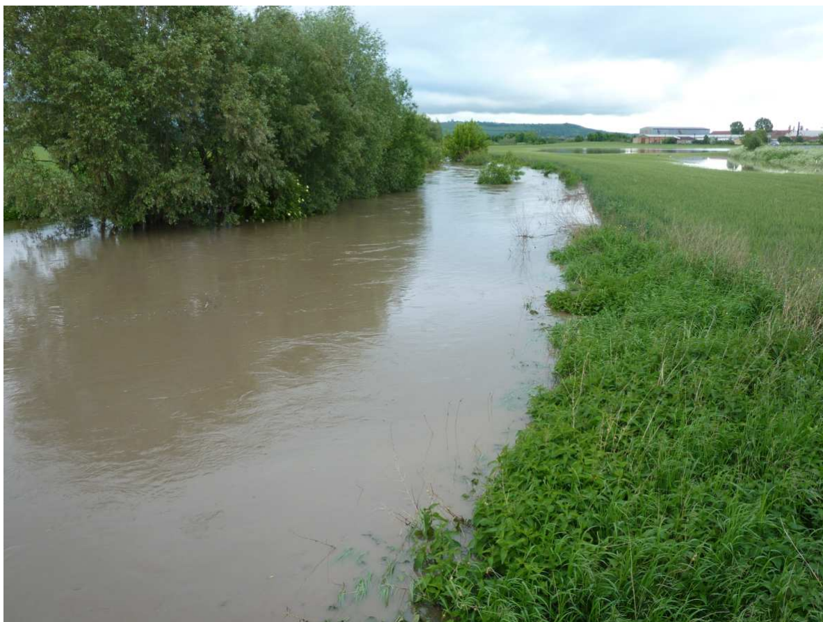
Voda z plného koryta Cezavy se vylévá do polí – pohled od mostu na státní silnici (2.6.2010)