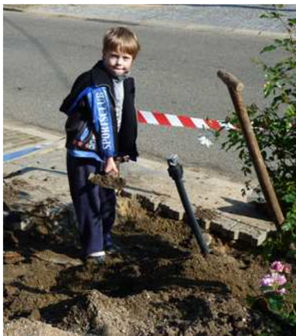
Občané dokončují napojení na kanalizaci.