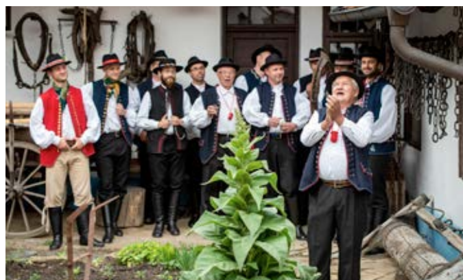
Mužáci v Těšanech

OBCENÍ ZPRAVODAJ – vydává obec Žatčany, dne 14. 8. 2020, náklad 350 ks, řídí redakční rada, tisk povolen MK ČR E 12700. Neprošlo jazykovou úpravou. Redakční rada: Ing. František Poláček, Mgr. Tomáš Kalla, grafika-příprava a tisk Radek Lejska. Příspěvky můžete odevzdávat na OÚ Žatčany nebo zasílat e-mail: obec@obeczatcany.cz