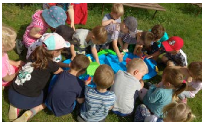
Vozík na vodní hry v MŠ