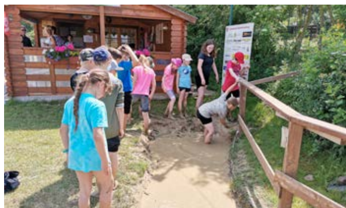
Škola na výletě