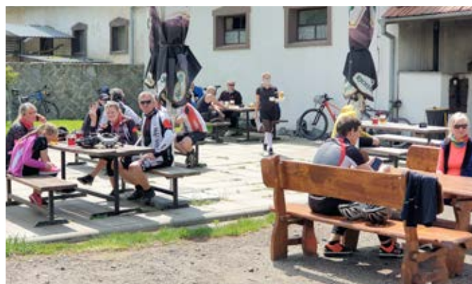
Jarní cyklovýlet – Jalový dvůr