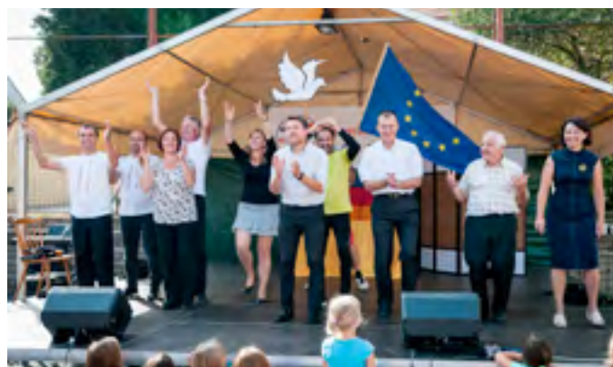
Farní den 2018