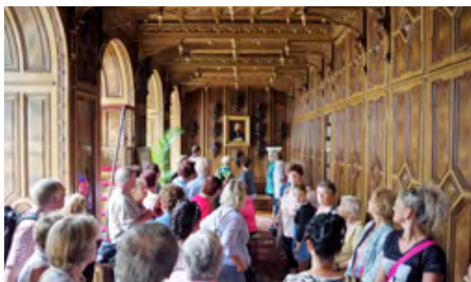
Výlet do Lysic a Rudky – Kunštátu