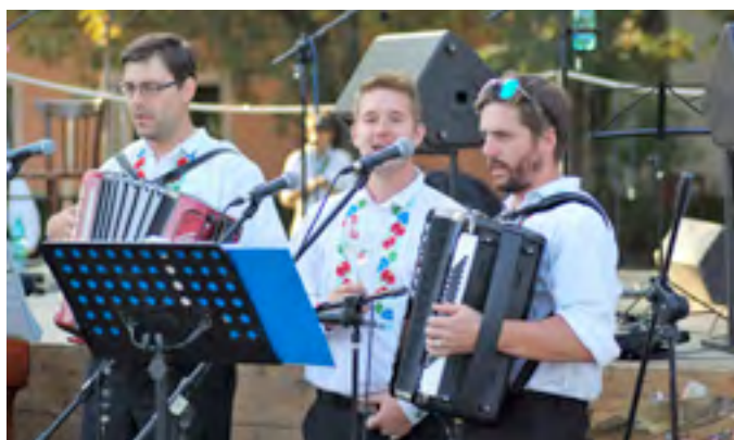
Oslavy k výročí 100 let ČSR