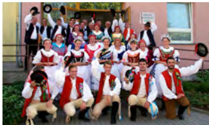
Národopisné slavnosti v Těšanech