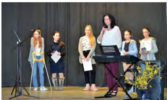
Korálky – přehlídka dětských talentů