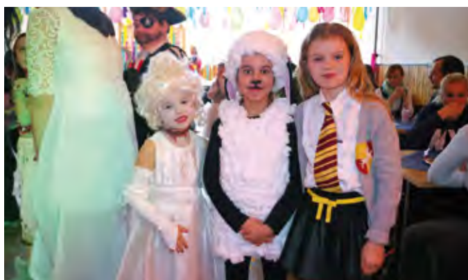
Dětský maškarní ples