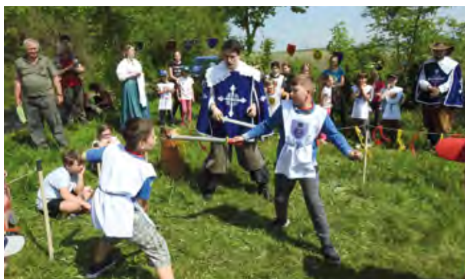
Pochod do Starého lesa