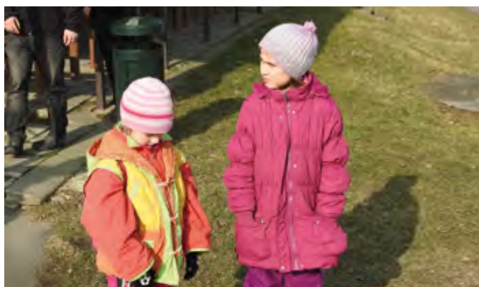
Den pro obec