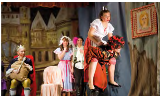
Divadlo Vyměněná princezna