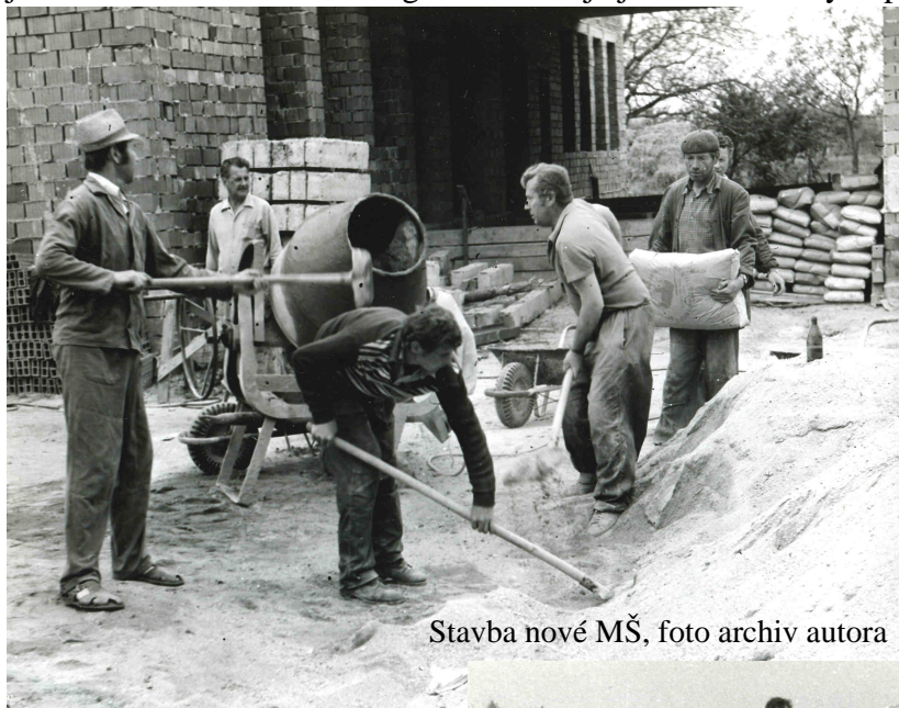
Stavba nové MŠ

Nové výstavba moderních vilek začala po 2. světové válce. Vzniklo 7 domů a před dokončením je novostavba Michala Habigera. V ulici je ještě řada volných parcel k další výstavbě.