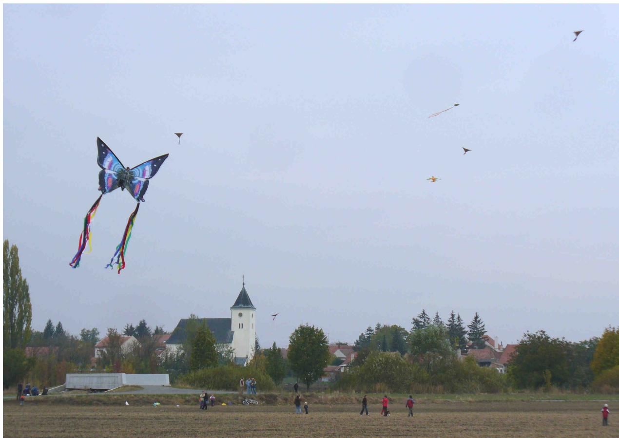
Drakiáda pořádaná v sobotu 24. října odpoledne ve spolupráci MK Alka a ZŠ a MŠ Žatčany