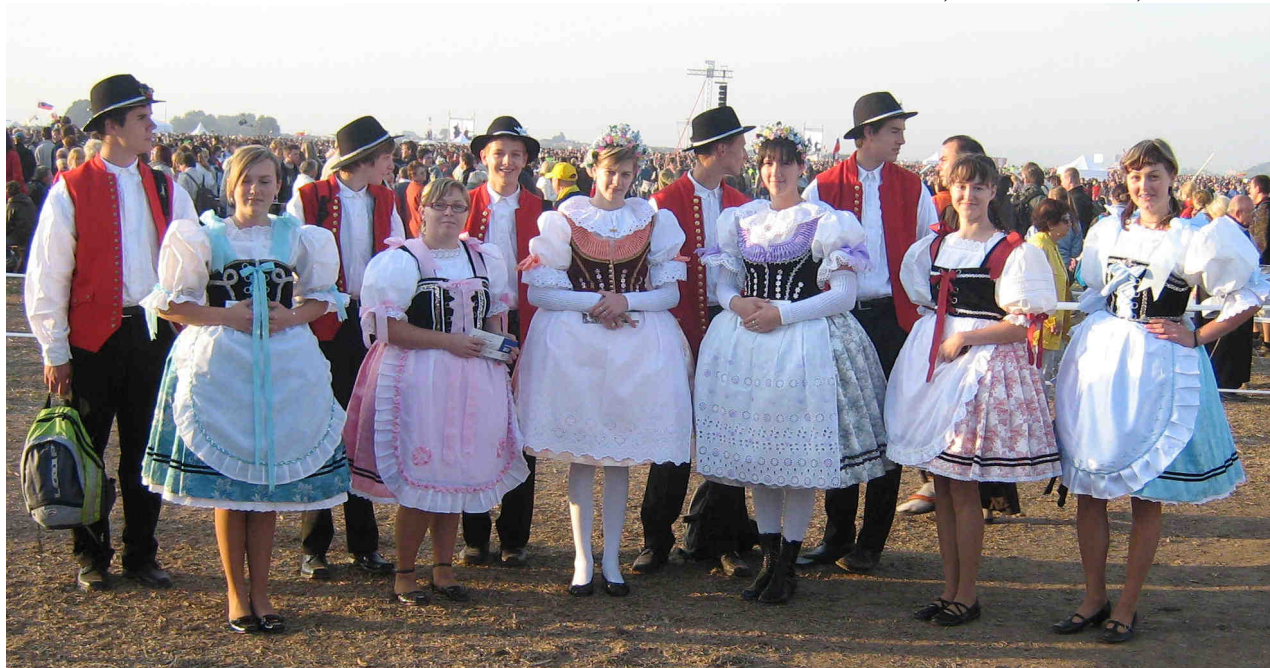
Krojovaná mládež ze Žatčan a z Moutnic v den návštěvy papeže na tuňanském letišti

Josef Sedláček, kronikář obce