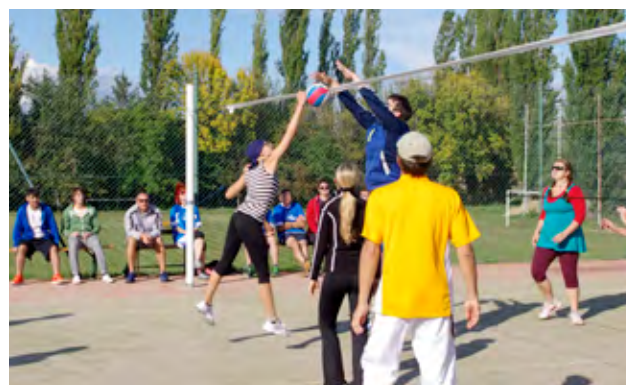
Volejbalový turnaj o pohár starosty