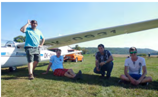
Alka v roce 2015