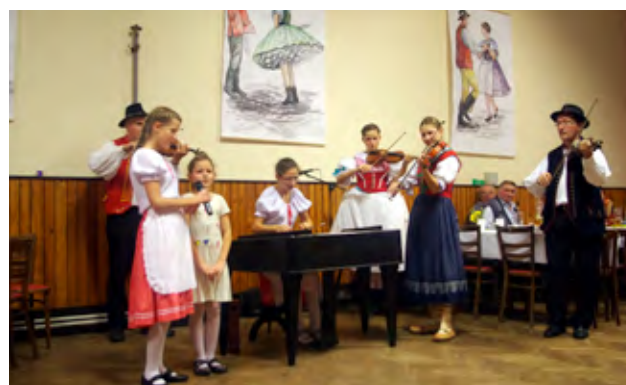
Martinské posezení u cimbálu

OBECNÍ ZPRAVODAJ – vydává Zastupitelstvo obce Žatčany, náklad 300 ks, řídí redakční rada, tisk povolen MK ČR E 12700. Neprošlo jazykovou úpravou. Redakční rada: Ing. František Poláček, Edita Bílá, grafika-příprava a tisk Radek Lejska. Příspěvky můžete odevzdávat na OÚ Žatčany nebo zasílat e-mail: obec@obeczatcany.cz