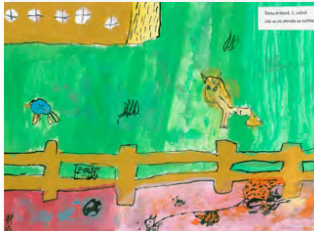
Sára Šimáčková, 2. ročník Líbí se mi přeměna ve můčku.