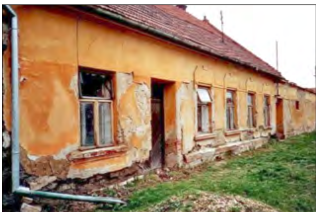
Na čísle 124 stávala Brabencova pekárna, nyní přestavěna

Bývala Teplého pekárna na č. 36 před demolicí