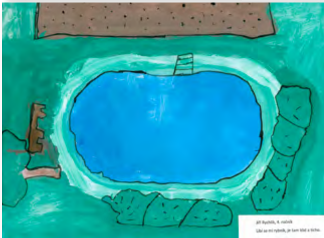
Jiří Ryšáček, 4. ročník Líbí se mi rybník, je tam voda a tráva.