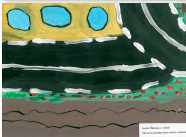
Anaška Šimáčková, 2. ročník Líbí se mi, že každý máme roztomilý rybníček.