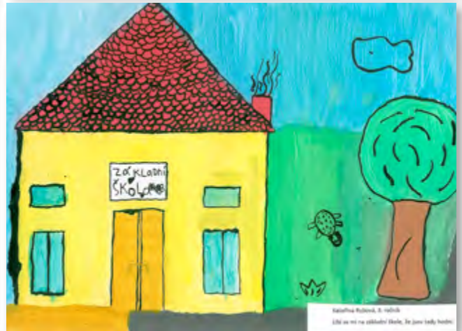
Kateřina Polková, 5. ročník Líbí se mi na základní škole, že jsou tam knihy.