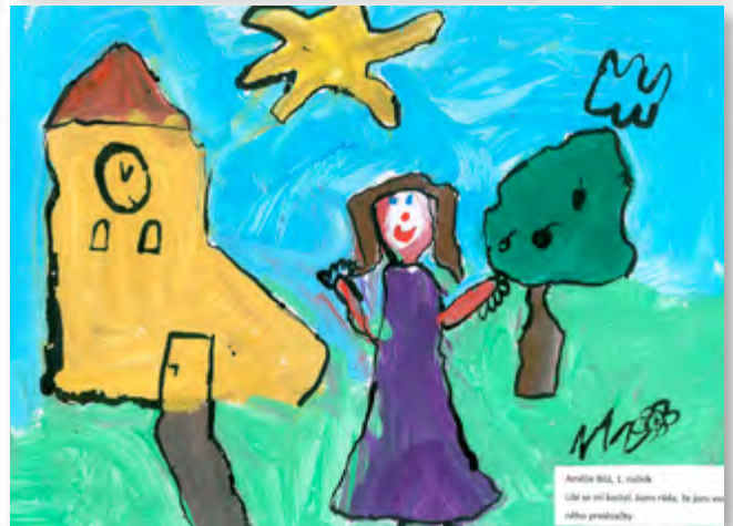
Amelie Bělá, 1. ročník Líbí se mi škola. Jsou knihy, že jsou to rádši předčítání.