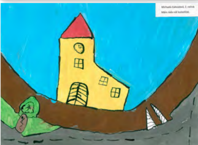
Michaela Šimáčková, 2. ročník Máme ráda náš kostelíček.