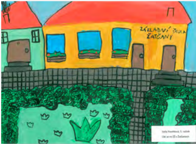
Tatka Pavlaček, 5. ročník Líbí se mi Zátčany.