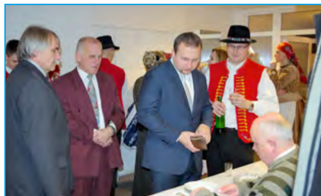
Vzácný host na krojovaném plese