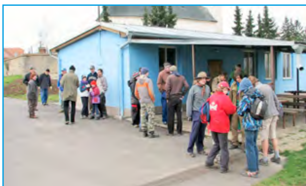
Den pro obec