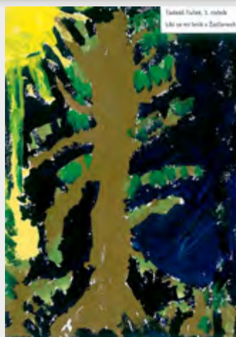
Davidka Fučík, 3. ročník Líbí se mi lesík v Zlatovcech.