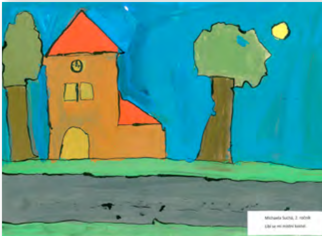
Michala Šuštil, 2. ročník Líbí se mi město Zátčany.