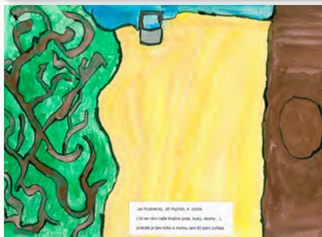
Jana Šimáčková, 1. ročník Líbí se mi, že budu je držet u konce. Líbí se mi, že budu je držet.