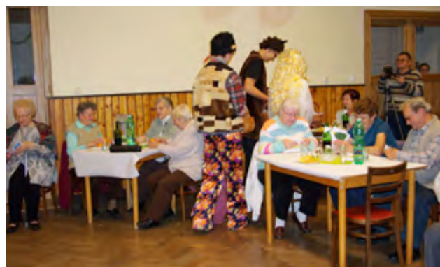
Předvánoční setkání se seniory