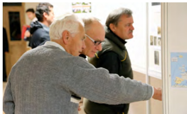
Výstava ke stému výročí zahájení I. světové války