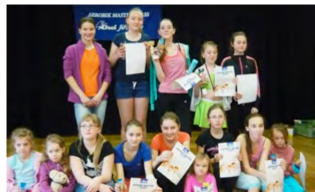
Miss aerobic 2014