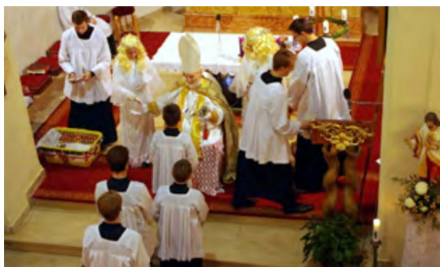
Svatý Mikuláš v žatčanském kostele