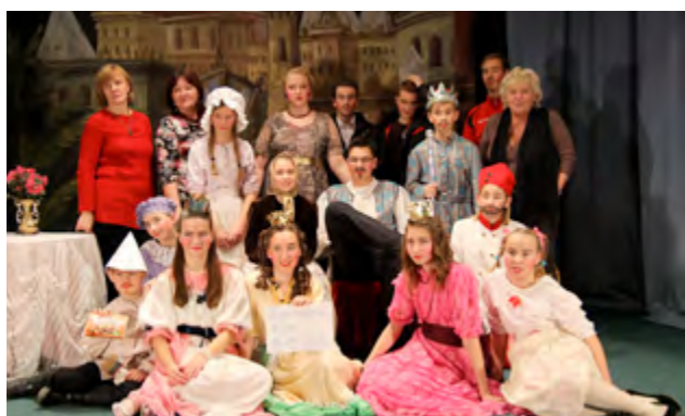
Dětské divadelní představení v sokolovně