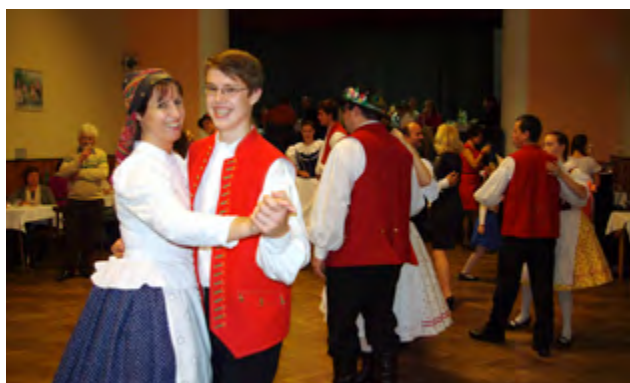
Svatomartinské posezení u cimbálu