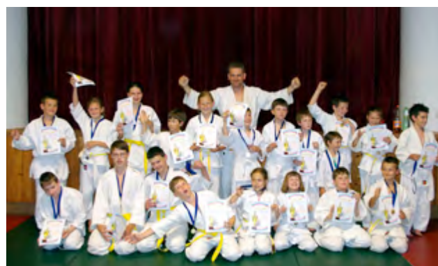
Mladí judisté v Žatčanech