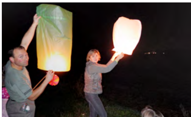
Světlušky – lampiony štěstí