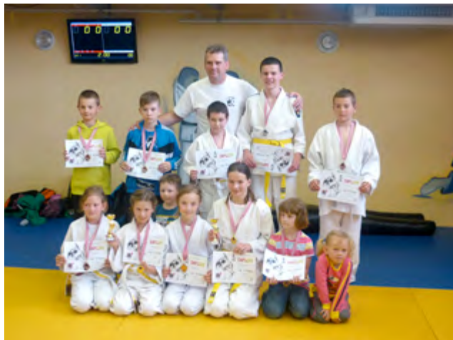
Velikonoční turnaj Uh. Hradiště – Klein, Teplý