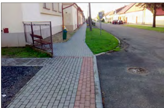
Byly také opraveny chodníky v ulici K Nesvačilkce v ceně 950 tis. Kč .