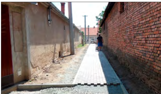
Zámkovou dlažbou zpevněna Kalvodova ulička za 130 tis. Kč.