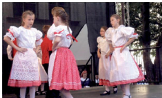
Brněnsko v tanci

OBECNÍ ZPRAVODAJ – vydává Zastupitelstvo obce Žatčany, náklad 300 ks, řídí redakční rada, tisk povolen MK ČR E 12700. Neprošlo jazykovou úpravou. Redakční rada: Ing. František Poláček, Mgr. Eva Stiborová, grafika-příprava a tisk Radek Lejska. Příspěvky můžete odevzdávat na OÚ Žatčany nebo zasílat e-mail: obec@obeczatcany.cz