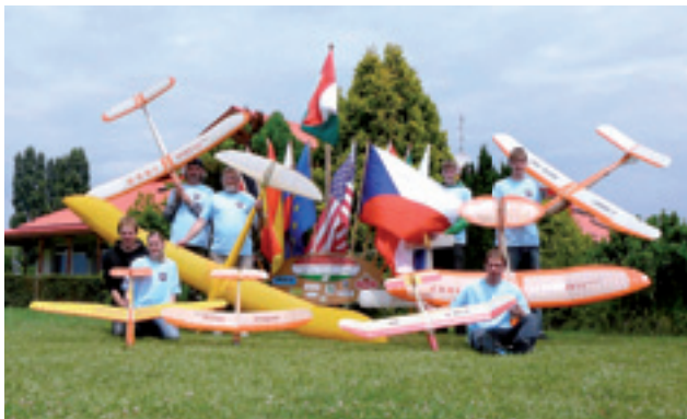
ALKA v Maďarsku