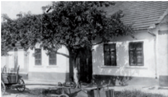
Dům č. 83 (nyní 183)