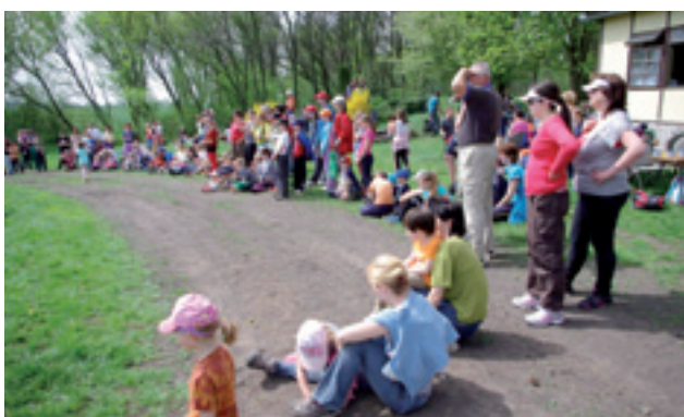
Pochod do Starého lesa