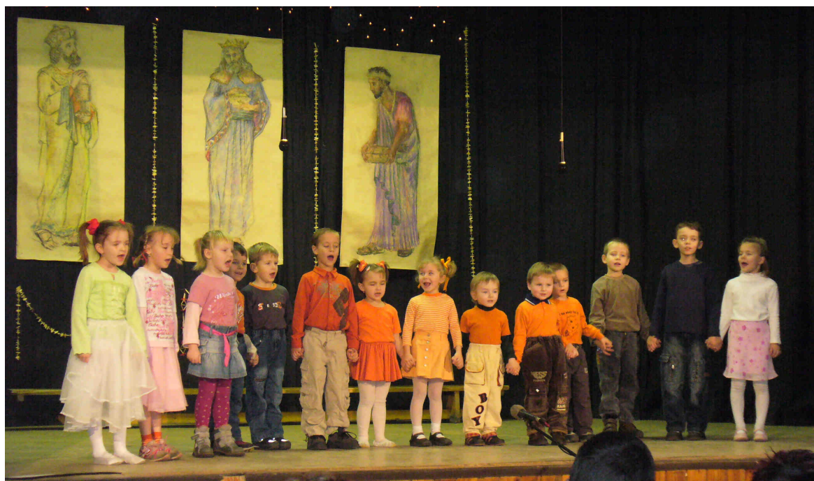
Tříkrálová koleda v orlovně