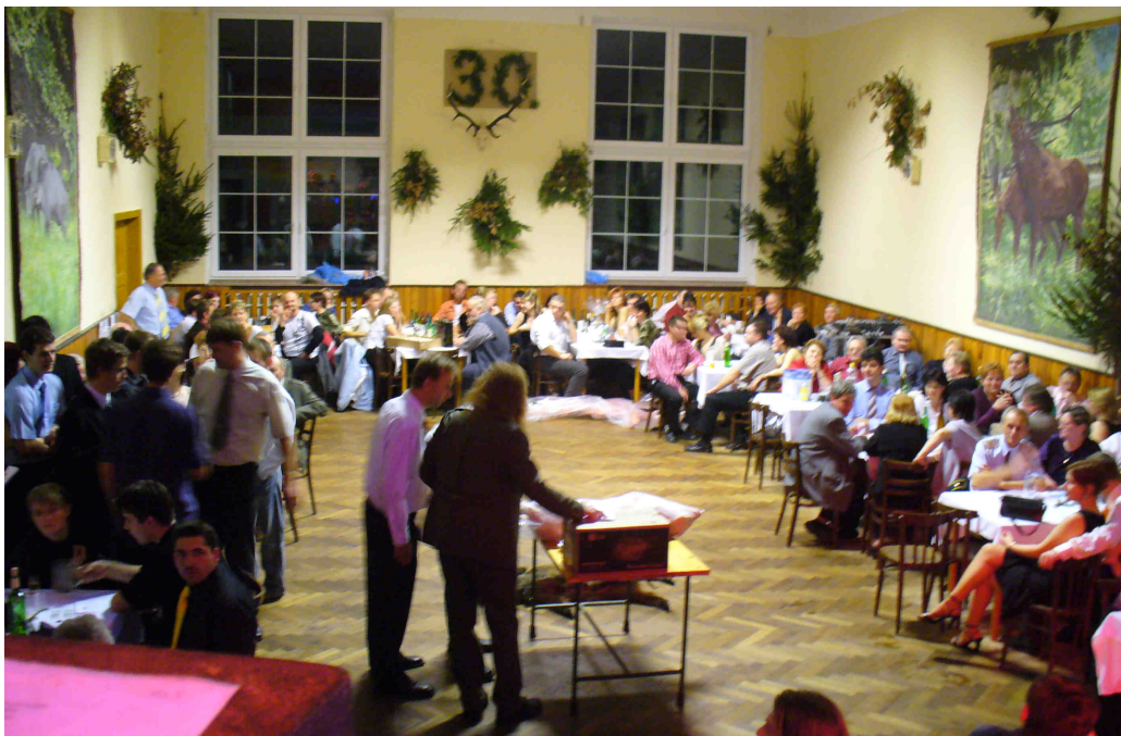
PS. 31. myslivecký ples bude 11. ledna 2008.

Takovým startovacím impulsem dalšího plesu se může stát i suché konstatování, pronesené nad ránem jedním žatčanským spoluobčanem, který připravuje zábavy v jiné organizaci: „Dnes jste nám nasadili vysokou laťku.“