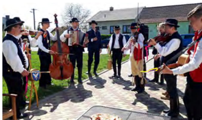
Velikonoční pondělí v Žatčanech