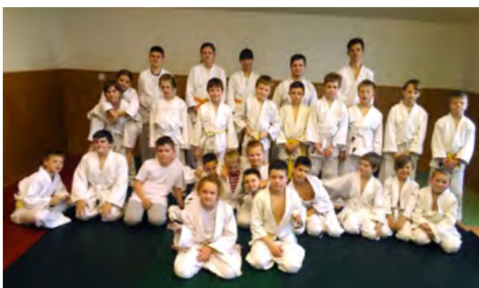
Vyhlašení nejlepšího judistu za 2018