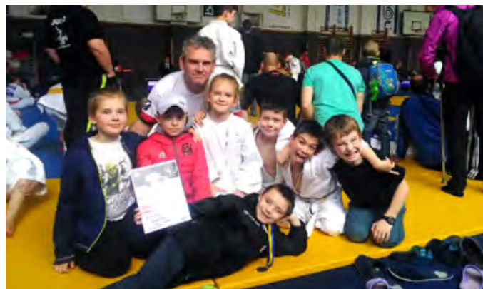
Turnaj Velká Bíteš