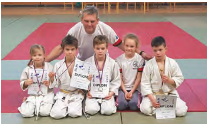
Lízátkovy turnaj Uherský Brod