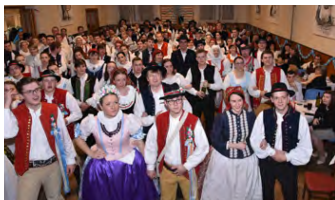
9. Krojovaný ples