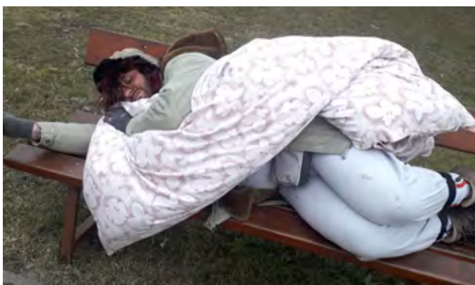
Ostatková pochůzka po obci