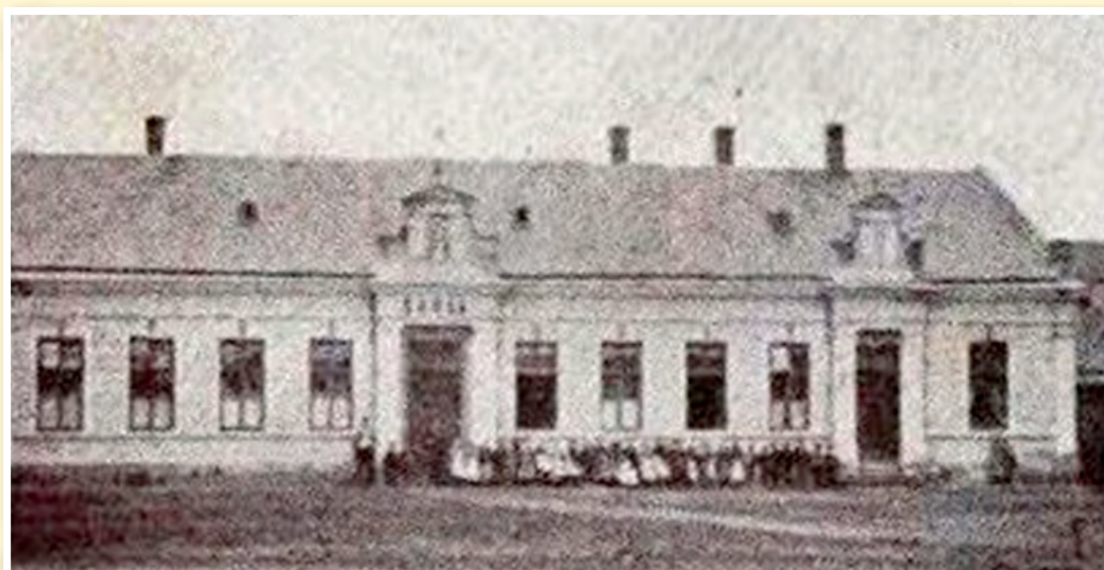
Škola kolem roku 1900