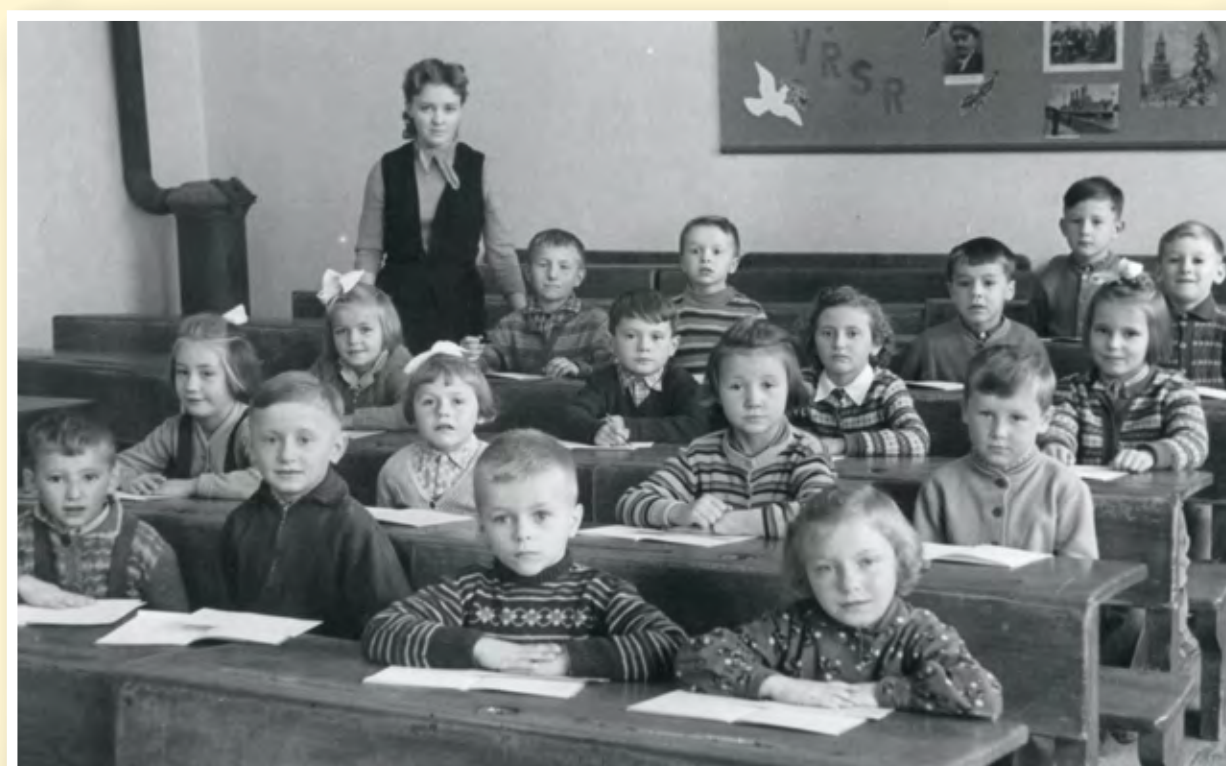
Výuka v ZŠ v roce 1959

V roce 1954 byl opraven školní byt, zřízena šatna a umývárna pro žáky. V roce 1958 byl zaveden vodovod a v letech 1960–1961 přistavěno sociální zařízení. Parkety ve škole jsou z let 1972 a 1973. Střecha školy byla opravena v roce 1991, kompletní rekonstrukce střechy proběhla v roce 2016. V roce 2017 bylo rekonstruováno topení.