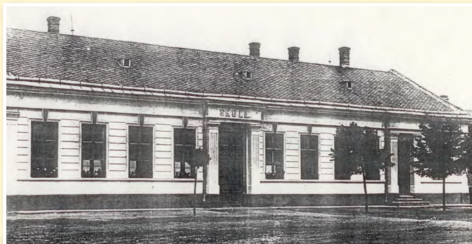
Škola před 2. světovou válkou

Před rokem 1815 sloužila jako škola stará chaloupka s doškovou střechou umístěná v rohu hřbitova. Pro nevyhovující hygienu byla zrušena, potom se učilo po různých domech v obci. V roce 1832 byl pro školu zakoupen dům č. 25 v Koutě. V roce 1856 tato škola s jednou místností vyhořela. Občané domek znovu opravili a školu rozšířili o byt pro učitele a malé hospodářství. Jelikož dětí ve škole stále přibývalo, učilo se na dopolední a odpolední směny. I tak malá jednotřídka nestačila. Roku 1860 bylo školou povinných 155 dětí. V letech 1880–1893 se počet žáků pohyboval kolem 140.