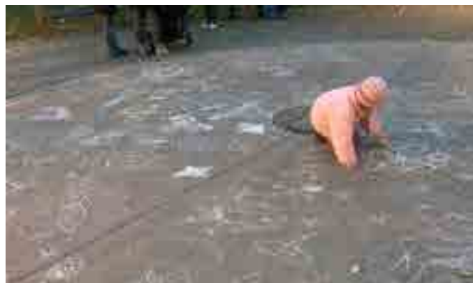
Malování a Světlušky