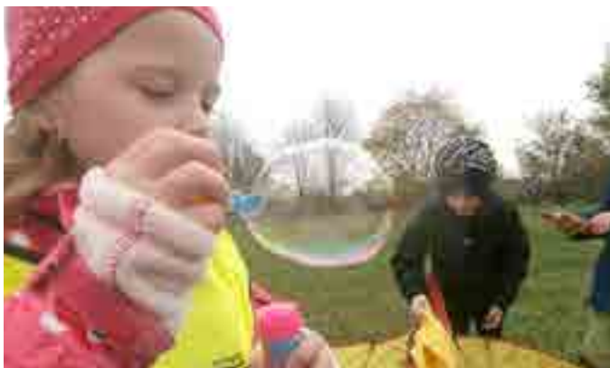
Z naší školky