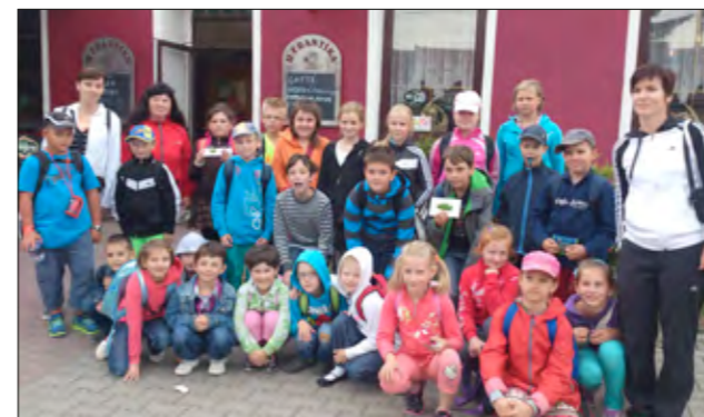
děti z Dražovic.