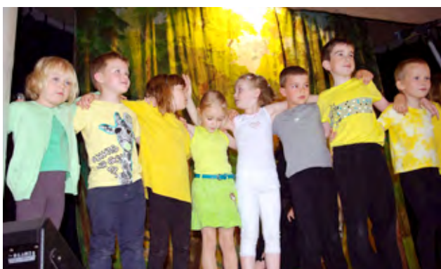
Oslavy 120 let výročí školy