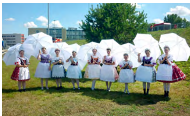
Předávání ocenění na MR mladých hasičů na VUT

OBECNÍ ZPRAVODAJ – vydává Zastupitelstvo obce Žatčany, náklad 300 ks, řídí redakční rada, tisk povolen MK ČR E 12700. Neprošlo jazykovou úpravou. Redakční rada: Ing. František Poláček, Mgr. Eva Stiborová, grafika-příprava a tisk Radek Lejska. Příspěvky můžete odevzdávat na OÚ Žatčany nebo zasílat e-mail: obec@obeczatcany.cz