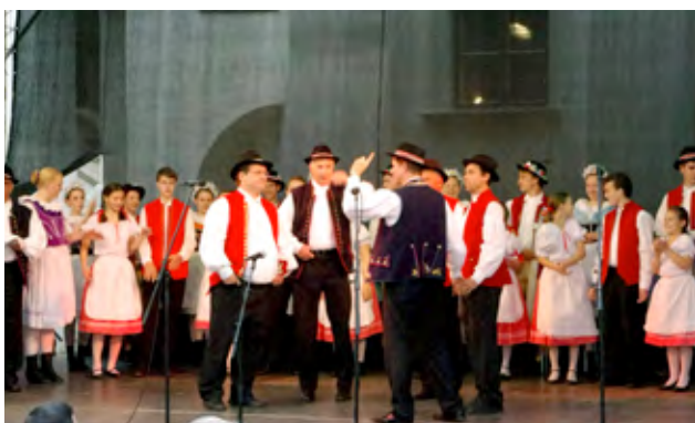
Brněnsko v tanci a písni