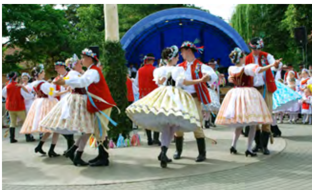
Hody – tanec pod májí