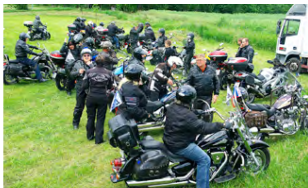
Motosraz – Vokuši