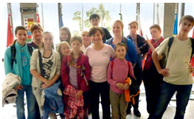
Návštěva našich dětí v Parlamentu ČR